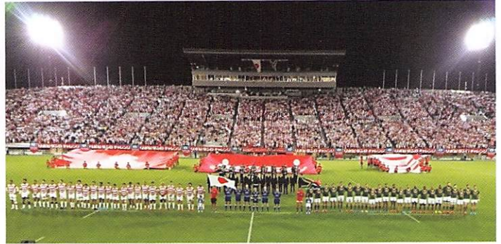
日本VS南ア社行試合(熊谷ラグビー場)