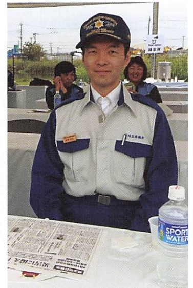
さいたま市防災訓練に参加しました。