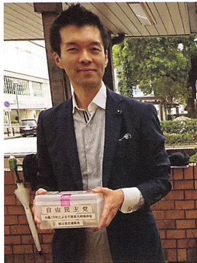
台風15号千葉県被災者支援募金活動を行いました。