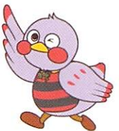
埼玉県のマスコット「さいたまッチ」

オンライン化や運転免許証とマイナンバーカードの一体化などの法改正により、今後、必ず、日曜日に最寄りの警察署などで免許更新が出来ようような動きが出てくるはずなので、他の都道府県に先駆けて埼玉県警察がいち早く複数個所で日曜交付が出来よう強く推し進めてまいります。